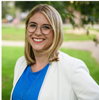
Chantal Kopf, Grüne (MdB, Europa-Ausschuss/ Verts députée européenne, commission des affaires européennes)